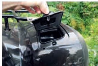
Har man något som absolut inte tål vatten gör man bäst i att placera detta i det främre facket.