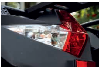
Undra om bakljuset kommer direkt från en Nissan 370z.