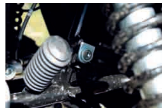
Att komma åt låset till styret är inte helt enkelt, men det är ändå ett bra attribut att ha.