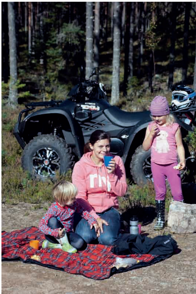
Att plocka bär och svamp blev betydligt roligare när Kymcon fick följa med.