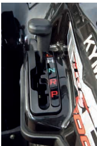
Efter att ha justerat infästningen av växellänkaget gled alla växellägena i utan motstånd.