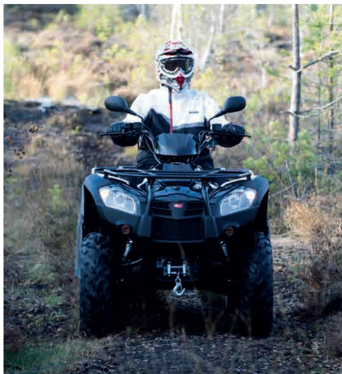
Ute i terrängen känns den riktigt smidig trots att det är en fullstor maskin.