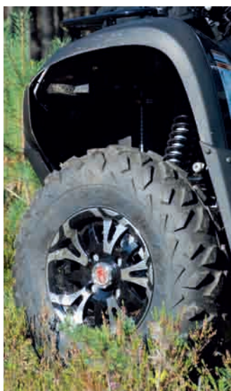
Det sitter riktigt snygga fälgar på MXU 500i IRS.

Scanna QR-koden för att komma till en liten film om maskinen.