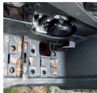
Fotbrädorna ger bra med fäste åt skorna. Bromsen är däremot lite högt placerad för våran smak.