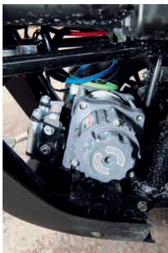
Redan standard kommer Kymcon med mycket utrustning, bland annat en vinsch.

Man kan lugnt säga att man får en riktigt kompetent maskin för pengarna, som mycket tack vare insprutningen är riktigt förtroendeingivande vad det gäller motorn. Valet mellan ett budgetalternativ med liten motor från någon av dom sju stora märkena och en välutrustad Taiwanes har nog aldrig varit svårare. Kymco MXU 500i IRS fungerar helt enkelt så bra att den tillfredställer alla mina normala krav på en fyrhjuling. Att man dessutom får 3 års garanti gör bara valet ännu enklare, eller om det nu var svårare? 🌟