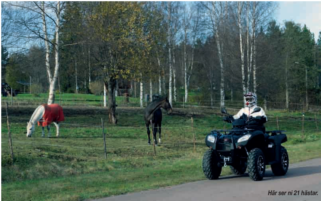
Här ser ni 21 hästar.