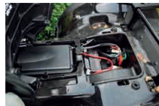
Under dynan sitter batteriet och luftburken väl åtkomliga.

räcker det dessutom allt som oftast med att bara släppa gasen inför en kurva. Då fotbromsen är lite högt placerad använder jag mig uteslutande av handreglagen, med vilka det dessutom är betydligt lättare att dosera för rätt bromseffekt.