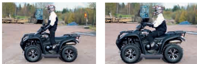
Man sitter ganska högt placerad på den sköna dynan, vilket ger en bekväm vinkel på benen. Lika bra trivs man stående bakom det höga styret.